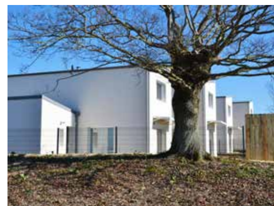
Val de Moine - Cholet