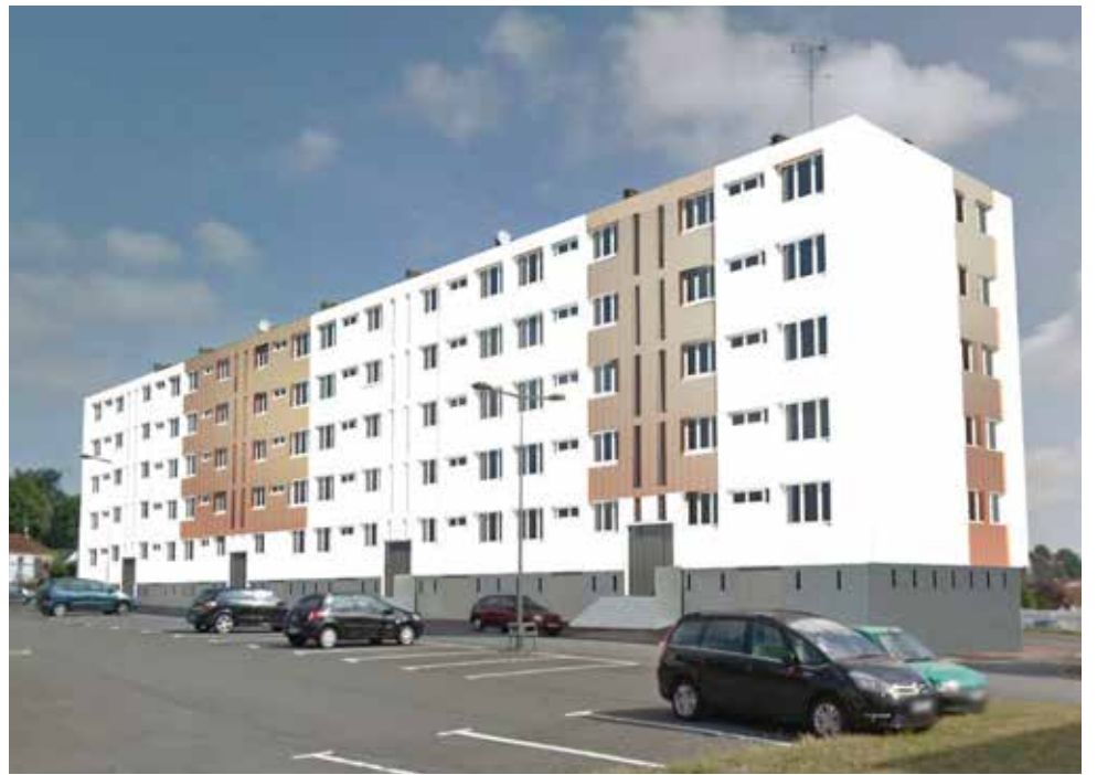
Esquisse - Dumont d'Urville

Le traitement des eaux pluviales fera l'objet d'une attention particulière pour limiter au maximum les rejets dans les tuyaux de collecte, en privilégiant des dispositifs « in situ » permettant l'infiltration au travers de noues, dans les espaces verts ou sous chaussée.