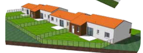
Esquisse - Les Cerqueux