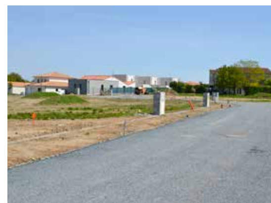
Le Ruisseau II - Saint Christophe du Bois