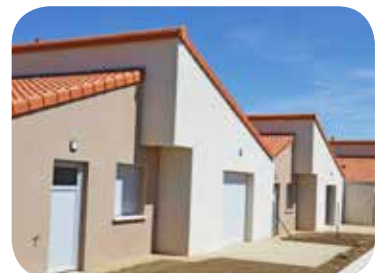
Les bretonnais locatifs

Les 6 locatifs individuels (4 T3 et 2T4) et les 2 logements en location-accession (2 T4) ont été inaugurés le