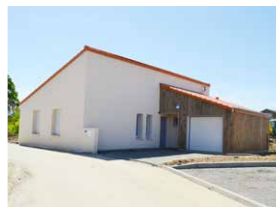
Les Bretonnais - Bégrolles en Mauges

Pour plus d'informations, rendez-vous sur : www.slh-habitat.fr dans la rubrique « Les Offres / Location - Accession ».