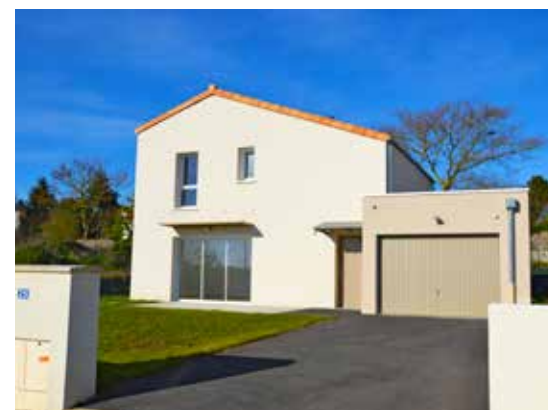
Le Hameau de la Fontaine - Jallais