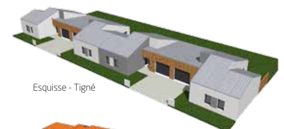
Esquisse - Tigné

Deux projets de 4 logements chacun sont prévus sur les communes de Tigné et Les Cerqueux sous Passavant. Les travaux devraient débuter en octobre 2019. Une pose de 1 e pierre sera réalisée en partenariat avec les deux communes, le 3 octobre prochain.